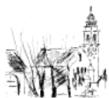
St. Bonifatius Überherrn